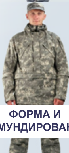
ФОРМА И ОБМУНДИРОВАНИЕ