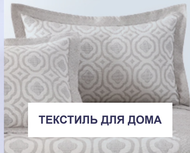
ТЕКСТИЛЬ ДЛЯ ДОМА